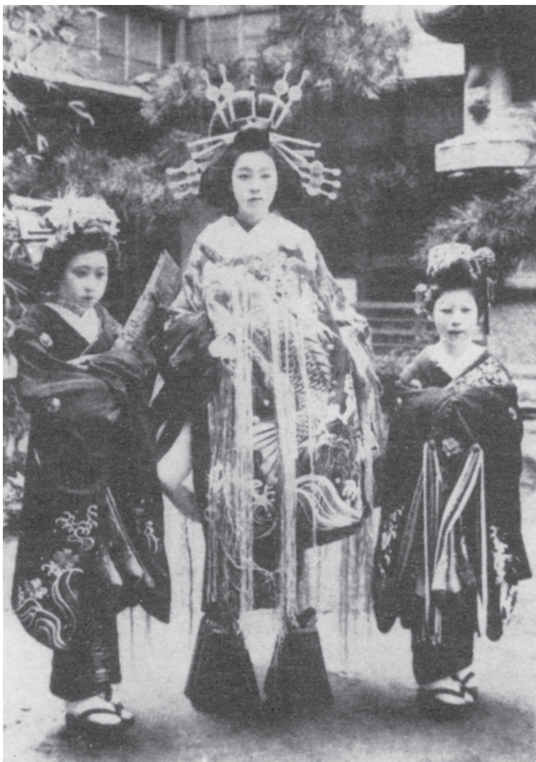
Kurtizana Usugumo iz kuće Kadoebi-ro u Jošivari, sa dve pratilje, april 1914.