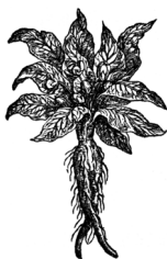
MANDRAGORA Atropa mandragora