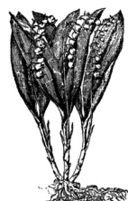
LJILJAN IZ DOLINE Convallaria majalis