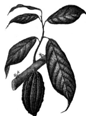
KAKAOVAC Theobroma cacao