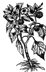
TATULA Datura innoxia