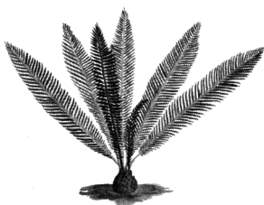
MEKSIČKA CIKADA Zamia furfuracea