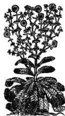
CIKORIJA Cichorium intybus