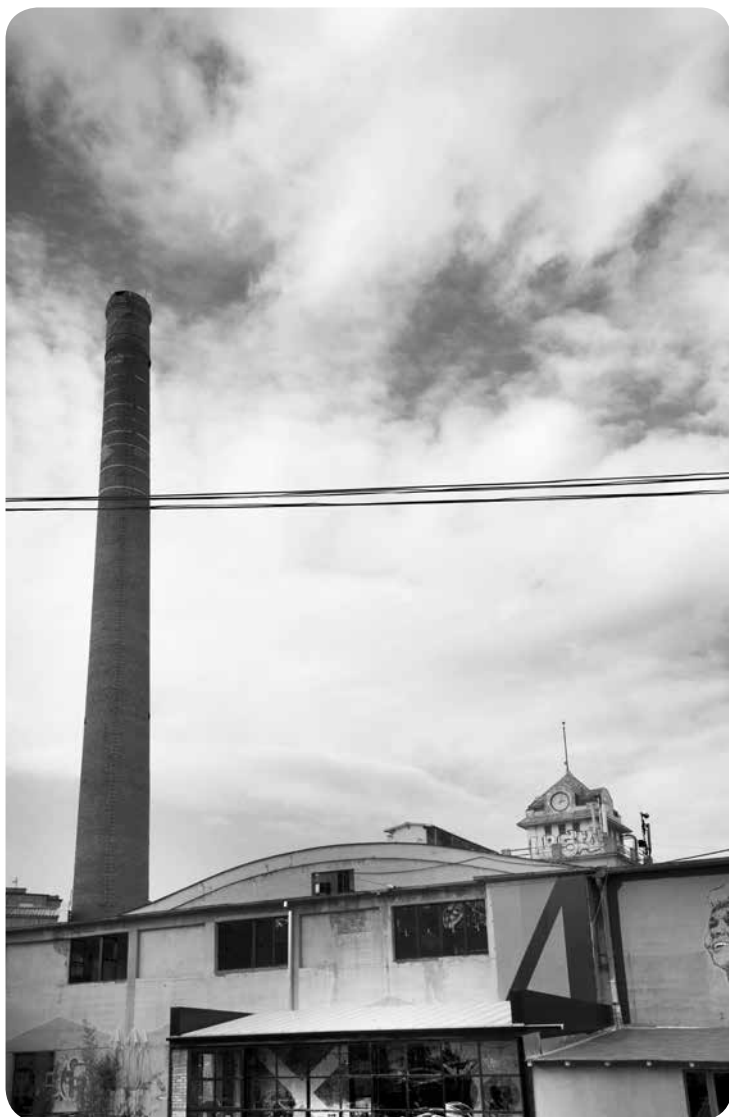
5. Dimnjak nekadašnje Bajlonijeve pivare