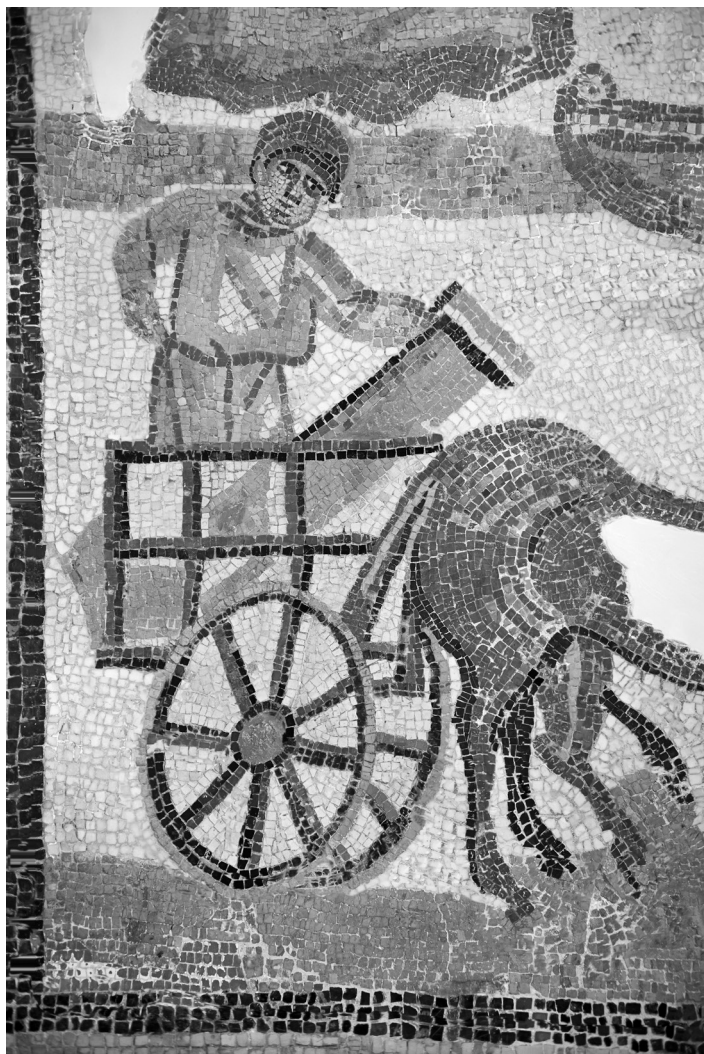
Mozaik – prikaz utovara lake dvkolicice

uzrok oštećenja. Zahvaljujući tome i ranijem zastoju Vibije već kasni. Novo kašnjenje predstavljalo bi propast.