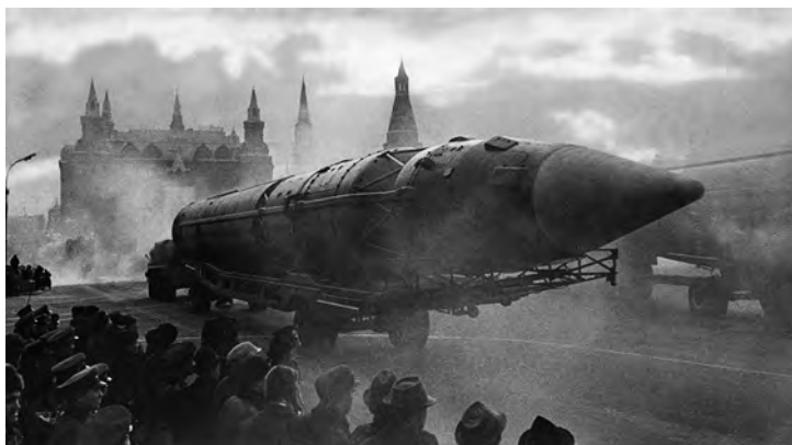
Nuklearni projektili na paradi u Moskvi. Čehovljeva puška koja uvek visi na zidu, ali dosad još nije okinula.

Mogućnost ipak ne bi trebalo da mešamo s motivacijom. Iako kiberrat uvodi nova oružja za razaranja, ne mora obavezno da doprinosi i inicijativi za njihovu upotrebu. U poslednjih sedamdeset godina čovečanstvo je raskinulo ne samo zakon džungle nego i zakon Čehovljeve puške. Čuvene su one reči Antona Pavloviča Čehova da puška koja u prvom činu visi na zidu neizbežno mora da opali u trećem. U čitavoj ljudskoj istoriji, ako bi kraljevi i carevi dobavili neko