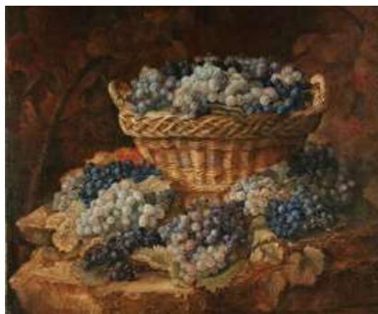
Катарина Ивановић, Корпа с јрожђем , 1837–1838.