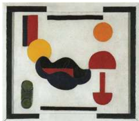
Тео ван Дисбург, Мртва природа, композиција 5 , 1916.