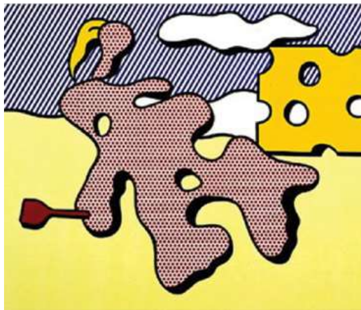
Рој Лихтенштајн, Акџ на йлажи , 1977.

Акџ је насликана или извајана нага људска фигура (нпр. богиња плодности у праисторији, прикази Адама и Еве у средњем веку).