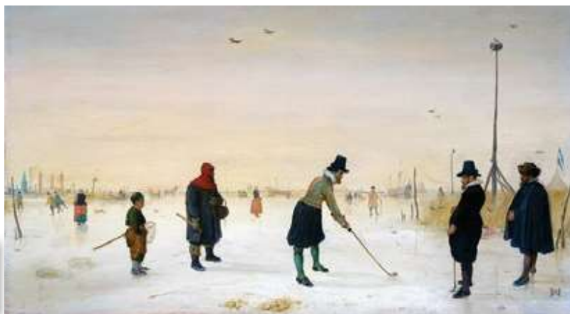
Хенри Аверкамп, Играчи колфа на леду , 1625.

На који начин људи који су приказани на сликама проводе своје време?