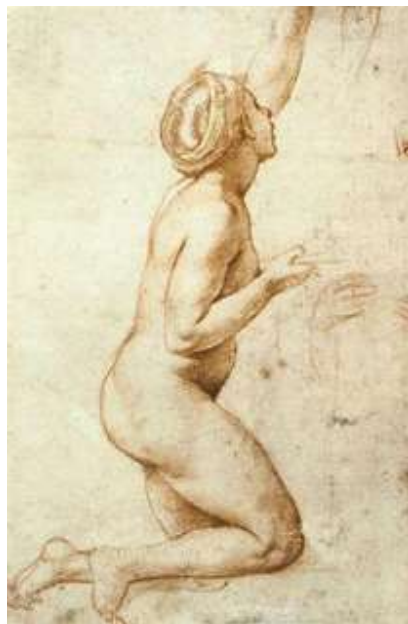
Рафаел, Наја жена клечи , око 1518.

За који од следећих примера сматраш да успешније одсликава нагу људску фигуру? Зашто?