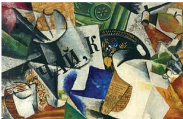
Љубов Попова, Мртва природа с послужавником , 1915.

Слике мртве природе приказују неживу природу (нпр. егзотично воће, музичке инструменте, цвеће, различите употребне и украсне предмете). Јављају се још у антици, на зидним сликама и мозаицима.