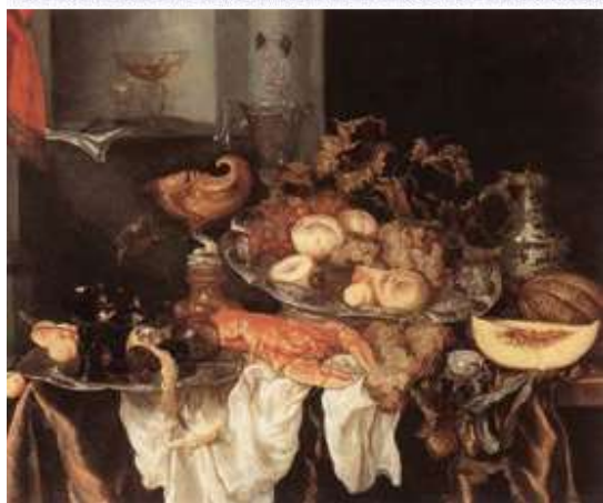
Абрахам бан Бејерен, Мртва природа , 1636–1690.

Упореди различите начине на који су уметници приказивали мртву природу.