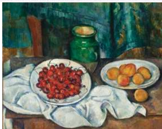
Пол Сезан, Мртва природа са вишњама и бресквама , 1885–1887.