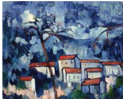
Морис де Вламенк, Пејзаж с црвеним крововима , 1907.

Слика неког природног или градског предела назива се пејзаж . У сликарству се најпре јављао као позадина неке радње. Тек у 15. веку настале су прве слике на којима је био приказиван само пејзаж.