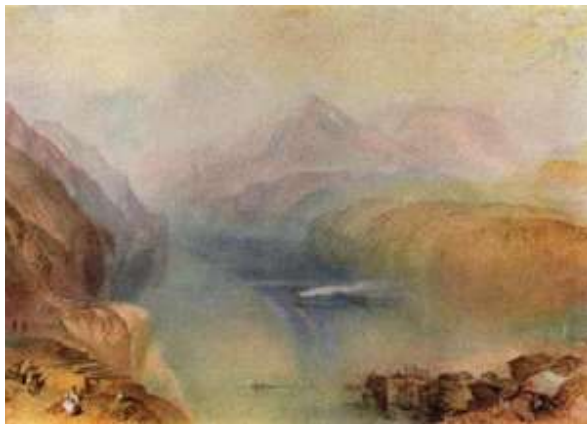
Вилијам Тарнер, Језеро Луцерн , 1802.

Опиши пределе на следећим сликама. Испричај како изгледа твој предео из снова.