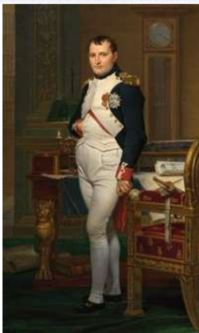
Жак-Луј Давид, Наполеон Бонапарт у својој радној соби, 1812.

Не гледајући назив слике, претпостави о каквој личности је реч. Шта окружење у ком се фигура мушкарца налази говори о њему? Опиши његово држање.