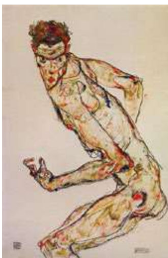
Егон Шиле, Борачи , 1913.