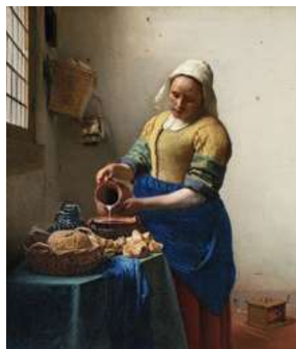
Јан Вермер, Млекарица , 1658–1660.