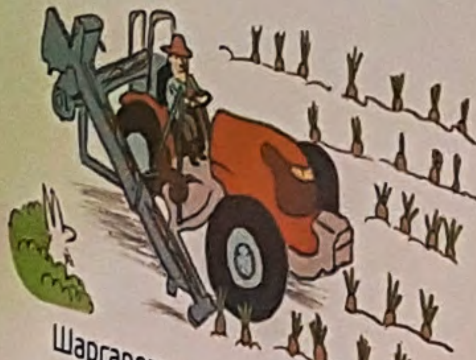
Шаргарепу вади вадилцом.