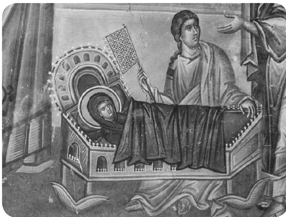
Суђаје на Богородичином рођењу, Краљева црква, Студеница (фреска)