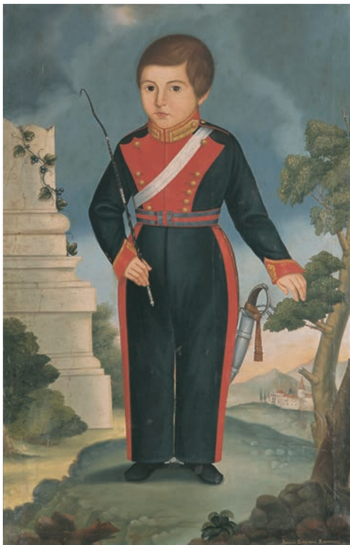
← Кнез Петар Карађорђевић 1845, портрет Арсенија Петровића (Народни музеј, Београд)