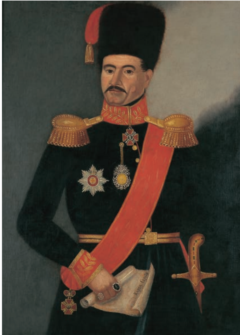
Кнез Милош 1835, портрет Уроша Кнежевића (Историјски музеј Србије, Београд)

најсвечаније прилике. Ови младићи одабрани из свих нахија, пореклом из „отмених” кућа, наочити, храбри и одважни, богато одевени у турска одела и раскошно наоружани чинили су телесну кнежеву стражу. „Момачка” служба у кнежевом конаку биће расадник будућих чиновника, народних старешина и носилаца највиших звања у земљи. 21 Овај принцип потрајаће све до скорашњих времена и многи гардијски официри оствариће врло успешне војне каријере чак и у много каснијим периодима и потпуно друкчијем друштвеном поретку. „Момци” или „кабадахије” биће главна оружана одбрамбена формација и на Двору младога кнеза Михаила. 22