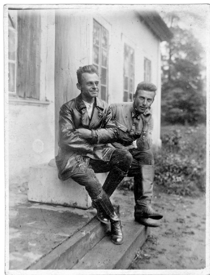
Vitold Pilecki s prijateljem u Sukurčama, oko 1930.

osmehuju. Kad primete njegovu uzdržanost i sposobnost slušanja, ljudi su ponekad pogrešno mislili da je kakav sveštenik ili dobronameran birokrata. Znao je da bude topao i da izlije osećanja, ali češće je ostavljao utisak da nešto prećutkuje, neki unutrašnji čvor koji neće razvezati; da li iz osećaja za formu ili zbog neke nerazrešene tenzije – žudnje da se i nadalje dokazuje – teško je bilo reći. Sebi je postavljao rigorozne standarde i znao da bude zahtevan prema drugima, ali nikad u tome nije išao u krajnost. Verovao je ljudima, a njegovo mirno samopouzdanje podsticalo je zauzvrat druge da njemu poklone poverenje. 5