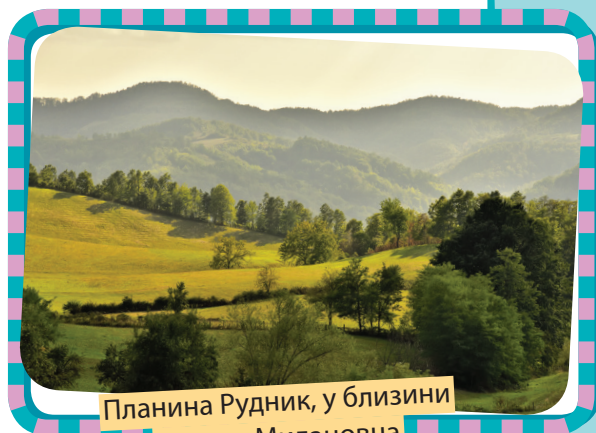
Планина Рудник, у близини Горњег Милановца