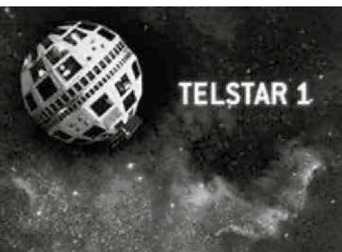
СЛИКА 1.2. Сателит Телстар 1

на неки начин укинуте државне границе у емитовању радијског и телевизијског програма, а можемо слободно рећи да је тиме интернационализован систем масовног комуницирања. Телстар 1 је годинама служио као веза између Европе и Северне Америке. Сателит је омогућио пренос слике и звука на велике даљине. Овај догађај је сигурно значајан за историју масовног комуницирања, као што је то својевремено представљао проналазак штампе. Овим чином је, осим почетка ере сателитске телевизије, започео процес глобализације масовног комуницирања.