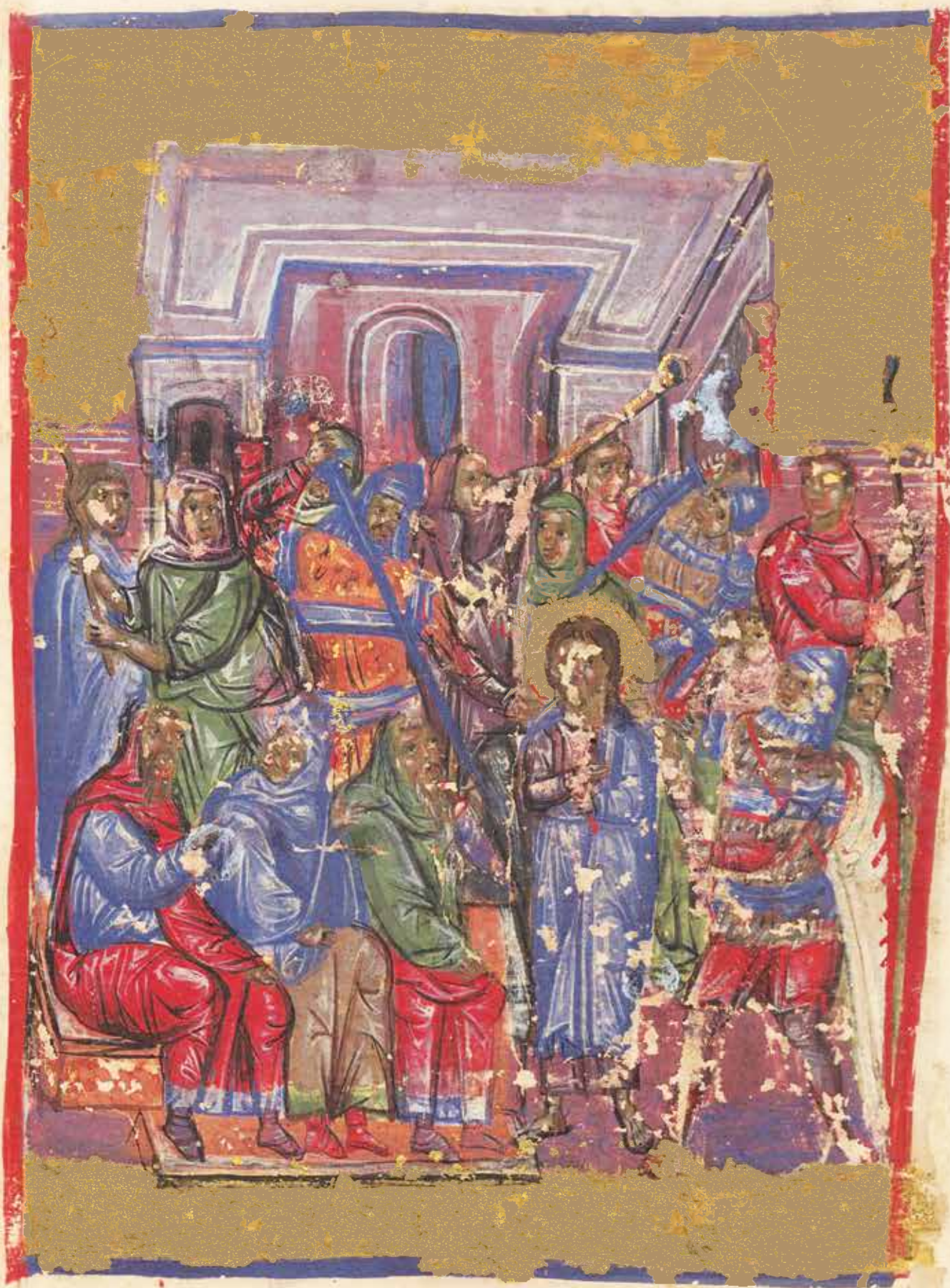
Кнезови се удружише против Господа и ухватише га, Псалом 2.2, Српски минхенски псалтир