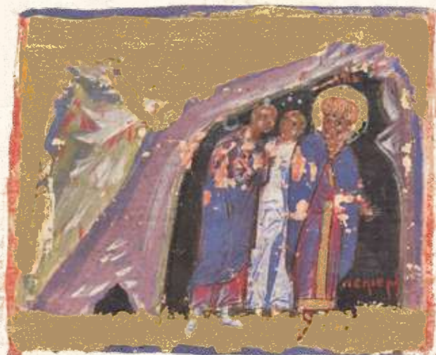
Давид се крије у пећини бежећи од свог сина Авесалома, Псалам 3, Српски минхенски псалтир