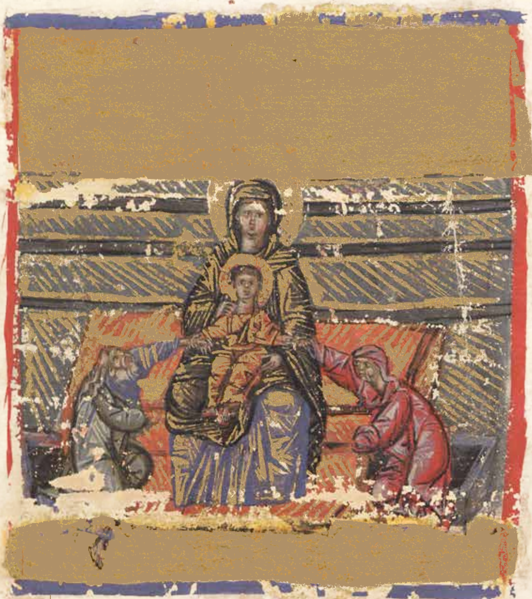
Богородица Марија са Христом у крилу који изводи Адама и Еву из Ада