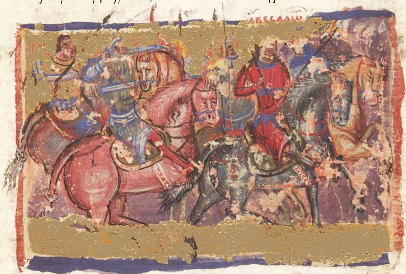
Авесалом гони свог оца Давида, Псалам 3, Српски минхенски псалтир

6 Не бојим се мноштва народа који са свих страна навалује на ме.