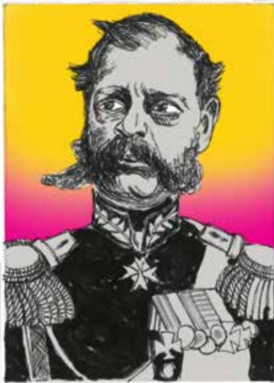
Александар II Николајевич, руски цар (1855–1881)