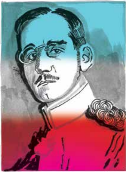
Александар I Карађорђевић, краљ Срба, Хрвата и Словенаца (1921–1929) и краљ Југославије (1929–1934)