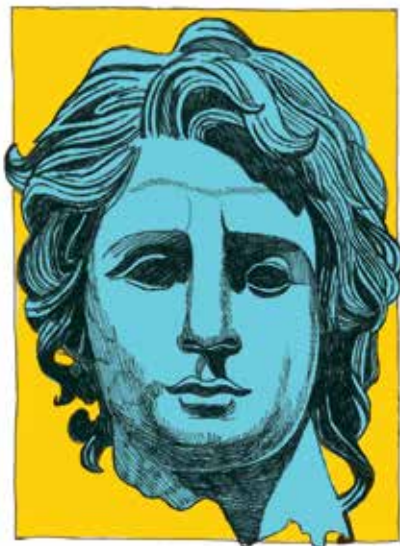
Александар III Македонски, македонски краљ (336-323. године п. н. е.)

Аристотел – старогрчки филозоф из IV века п. н. е., учитељ Александра Великог и оснивач чувене школе Лицеј у Атини