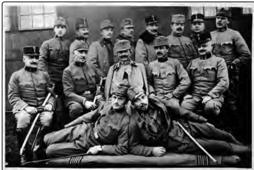
Стражарски одред жандармерије