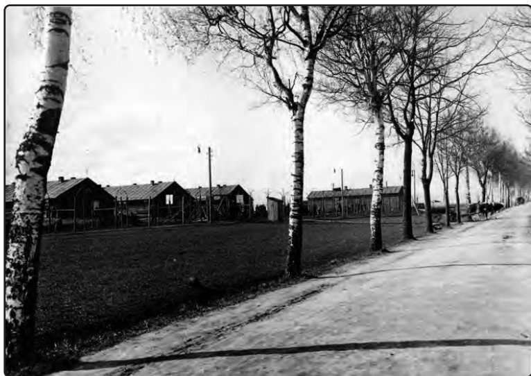
Бараке групе руских официра уз пут из Броумова ка Мартинковицама