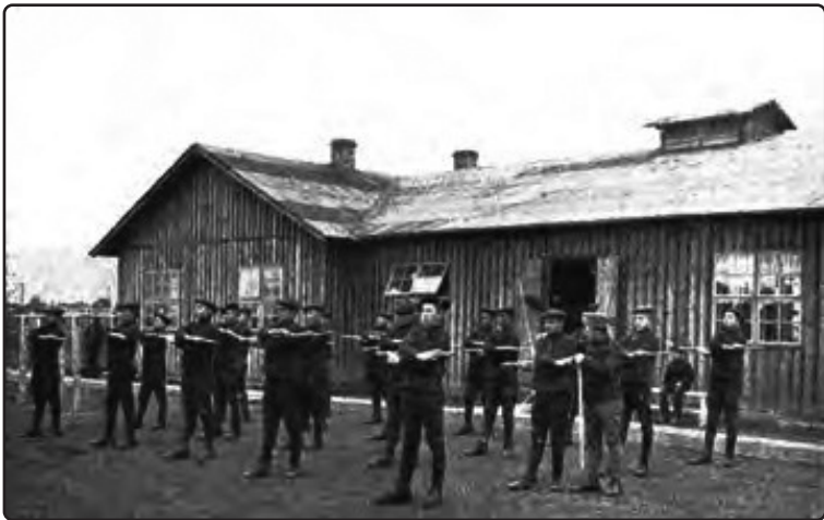
Српски дечаци на часу физичког васпитања испед зграде логорске школе.

Свака група барака састојала се од следећих објеката: 21 стамбена барака за затворенике, што је представљало капацитет од 5.000 људи, перионице веша, канцеларијске зграде, санитарне бараке (амбуланте), кухиње, магацина кантина, радне бараке (радионице) и покривеног патролног места.