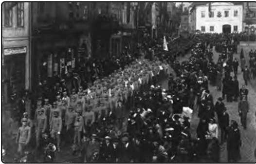
Први рањени војници на тргу у Броумову новембра 1914. године

Првобитне замисли држава Централних сила, дакле Немачке и Аустро-Угарске, да ће предузети брзе и успешне војне походе, показале су се погрешним. Аустрија се сусрела са жестоком српском одбраном, док је Немачка у настојању